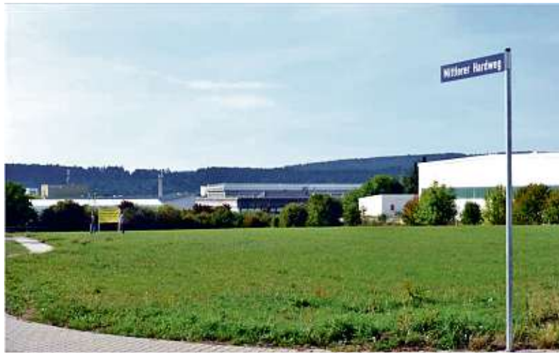
Auf diesem Grundstück sollen bald die Arbeiten beginnen. Bereits im ersten Quartal 2016 sollen die Hallen bezugsfertig sein.

Schutz vor Feuchtigkeit in Holzständerbauweise gebaut und durch Trennwände in 32 Boxen von bis zu elf Meter Länge aufgeteilt. „Die Wände können herausgenommen werden bei Bedarf“, sagt Kern. „Dann können wir Flächen von bis zu knapp unter 100 Quadratmetern anbieten. Auf Wunsch können auch Hebebühnen eingebaut oder eine zweite Ebene eingezogen werden.“ Was in den Hallen Platz finden soll, sei eigentlich egal. „Es müssen keine Fahrzeuge sein. Vorstellbar wäre auch ein Stützpunkt für Handwerker, ein Hochregal- oder Kleinlager. Wichtig ist nur, dass niemand sein Hauptgewerbe darin betreibt.“ Auch Hausrat, Ma-